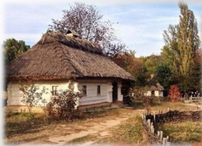
Рідна хата поета