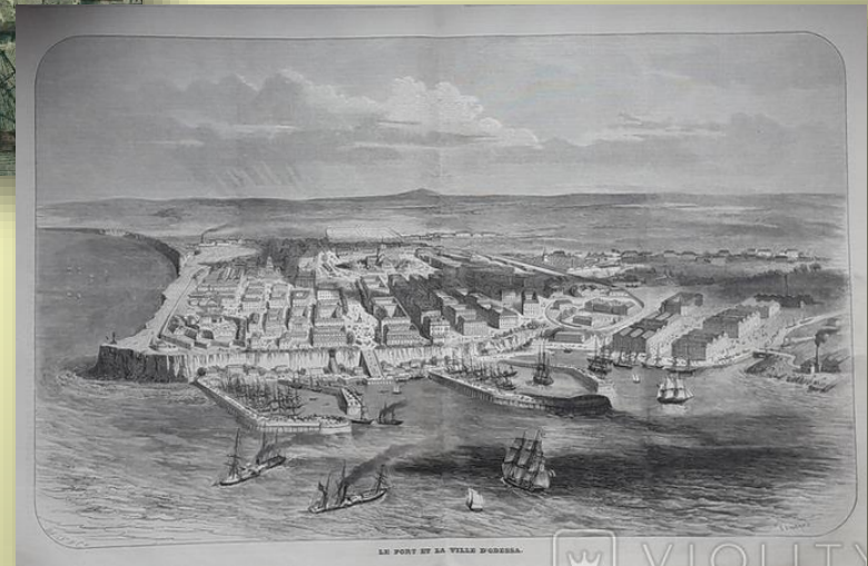
Одеса з висоти пташиного лету, 1850-ті роки