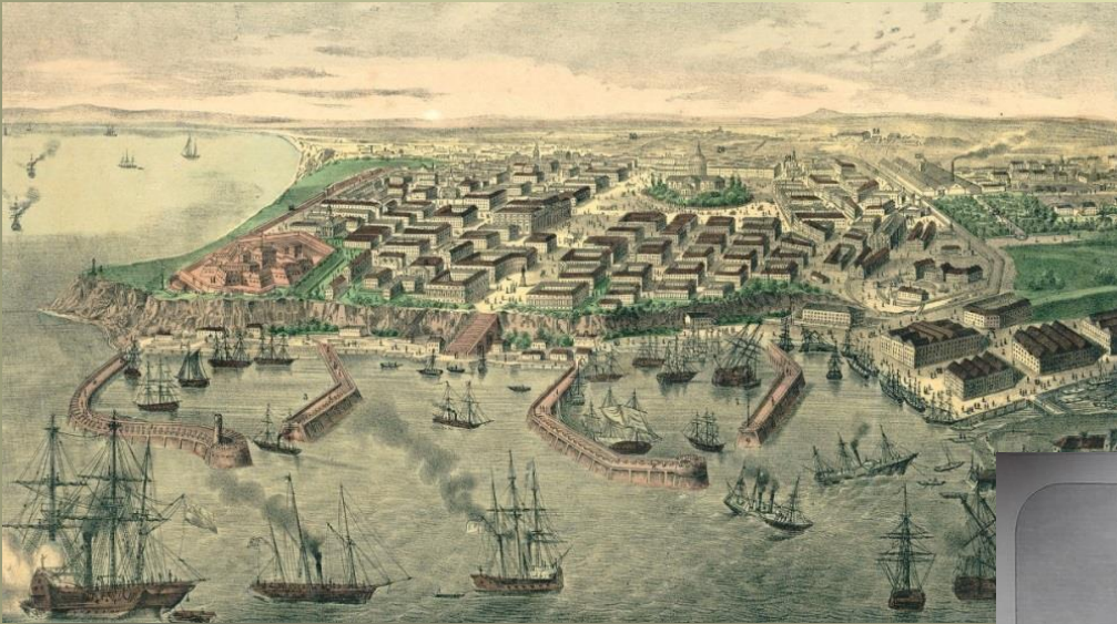
Краєвид Одеси, 1850 р.